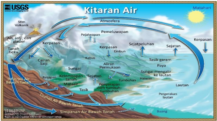
Rajah 2: Kitaran air semulajadi di bumi (United States Geological Survey, 2017).

air tersebut cukup mendalam. Air bawah tanah diserap oleh tumbuhan dan sebahagiannya meresap ke dalam tasik dan sungai. Selain itu, air bawah tanah juga boleh mengalir keluar sebagai mata air ke permukaan. Air bawah tanah ini juga akan mengalir semula ke lautan bagi memastikan kitaran air bumi terus berjalan. Rajah 2 menunjukkan kitaran air semulajadi yang berlaku di bumi.