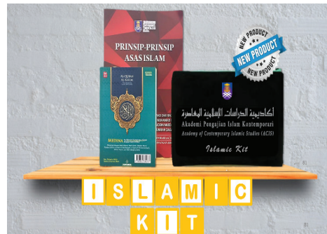
Gambar 1: Islamic Kit

pentingnya al-Quran di dalam sesi PdP di dalam kelas. Berikut adalah Islamic Kit yang diperkenalkan oleh pengkaji untuk kegunaan pensyarah ACIS UiTM CJKS dan pelajar.