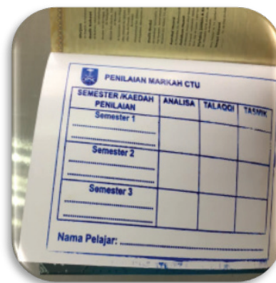
Gambar 2: Cop Penilaian Markah CTU

Bagi memanfaatkan sepenuhnya penggunaan Islamic Kit , pengkaji turut meletakkan cop penilaian markah dari semester satu hingga semester tiga pada helaian akhir al-Quran. Ini merupakan kaedah inovatif untuk tujuan pelajar memiliki dan membawa al-Quran sepanjang kuliah CTU selama tiga semester serta memudahkan para pensyarah membuat penilaian markah serta maklumat kepada pensyarah ACIS yang bakal mengajar pelajar tersebut pada semester akan datang. Berikut adalah contoh cop penilaian markah CTU yang disediakan untuk kegunaan pensyarah ACIS.